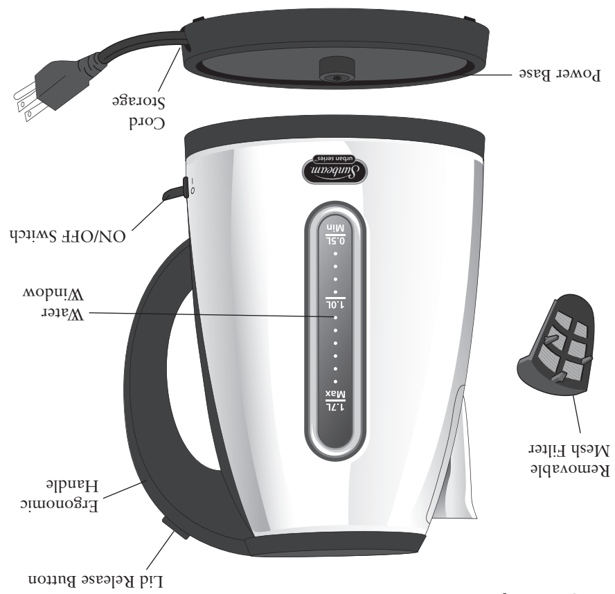
Diagram of parts