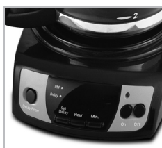
(Figura 1 – Set Delay)