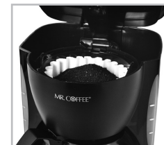
(Figura 2 – Cómo agregar agua y café)

¡PRECAUCIÓN! Para reducir el riesgo de dañar la jarra y/o de sufrir lesiones físicas, no agregue agua fría a la jarra si la misma está caliente. Deje enfriar la jarra antes de utilizarla.