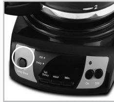
(Figure 1 – Set Delay)

To check the programmed time, push the SET DELAY button. The display will show the time you have programmed the coffee to brew.