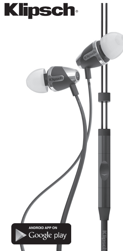
Image S4A Headphones

3502 Woodview Trace Indianapolis, IN 46268 1-800-KLIPSCH • klipsch.com